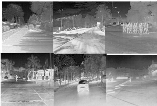
Rys. 1. Dane testowe i treningowe

Obrazy ze zbioru treningowego przeskalowano do rozdzielczości 512 x 512. Sieć konwolucyjna składa się z 3 warstw splotowych pomiędzy którymi stosowany jest algorytm MaxPooling. Następnie Uzyskana mapa cech zostaje poddana operacji flattening, zamian macierzy w wektor. Otrzymany wektor przechodzi przez dwie warstwy wielowarstwowego perceptronu, pomiędzy którego warstwami użyto funkcję aktywacji ReLu, gdyż stosowanie proporcjonalnych funkcji aktywacji znacząco ogranicza zagrożenie związane ze znikającym gradientem. Na warstwie wyjściowej znajduje się jeden neuron; jako funkcję aktywacji został zastosowany sigmoid.